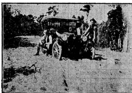
Itaquany — Seis quilômetros pela areia

Assim, no dia 28 chegaram à São Paulo, depois de cobrir 585 quilômetros em 12 dias.