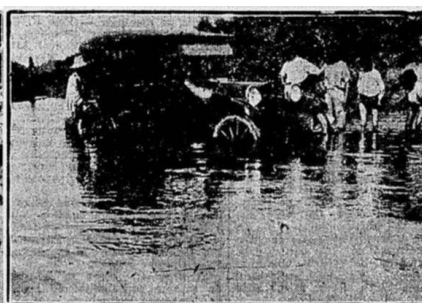
A 10 quilômetros de Mendes, em dia de chuva