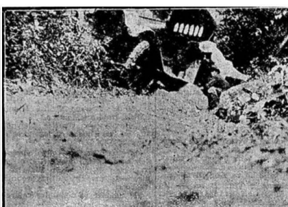
No rio Sant'Anna, Belem