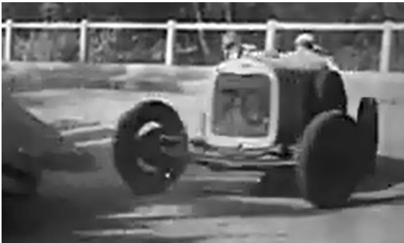
O Ford de Olavo Guedes na Gávea de 1936